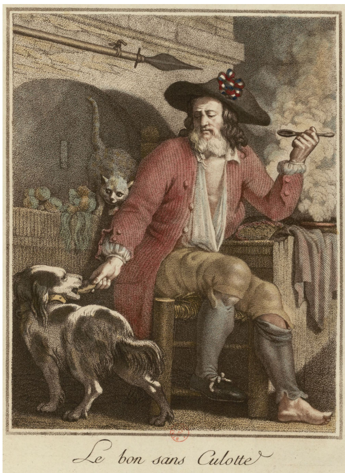
Le Bon sans-culotte (estampe, 1793-1794). Collection de Vinck. Un siècle d'histoire de France par l'estampe, 1770-1870, Vol. 45. http://gallica.bnf.fr/ark:/12148/btv1b6950361z .