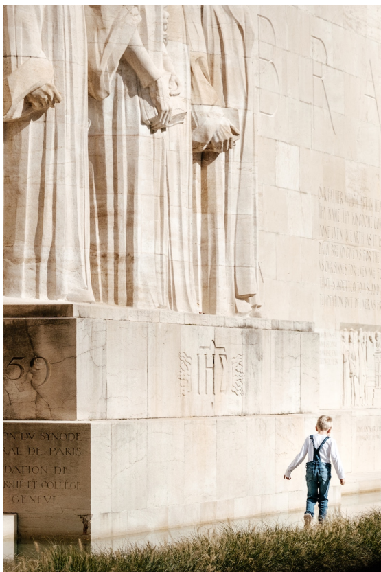
Geneva, Switzerland.

le Protestantisme par rapport au genre et à l'environnement représente un dernier défi que la dimension historique est encore à même de relever à l'heure actuelle.